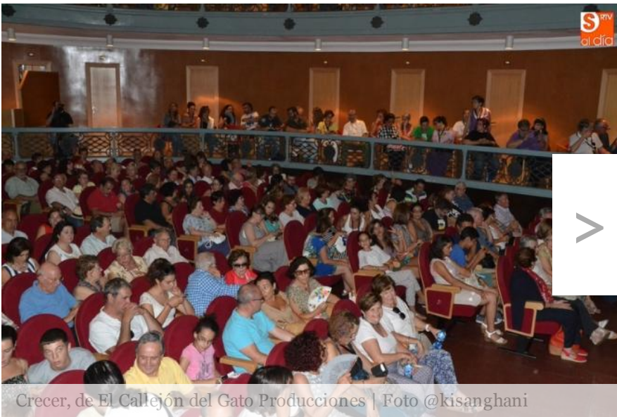
Crece, de El Callejón del Gato Producciones

testimonios de personas que cuidan a otras personas), el espectáculo trató precisamente sobre el cuidado a quienes nos cuidaron.