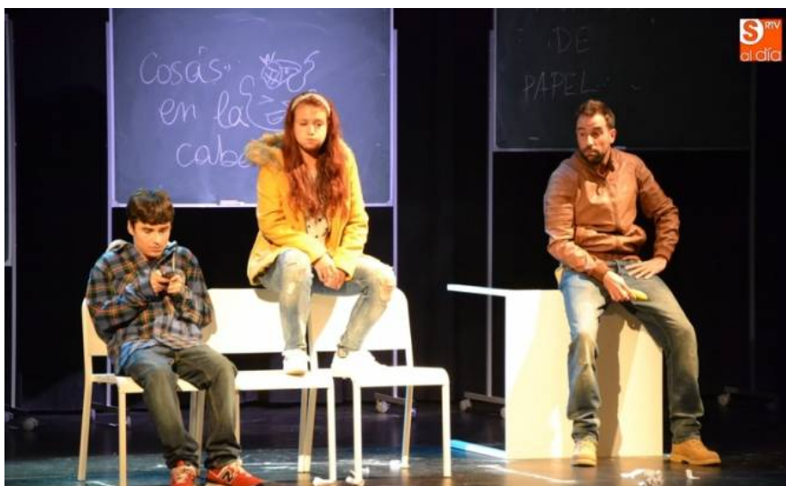
Crecer, de El Callejón del Gato Producciones

CIUDAD RODRIGO | Durante este bloque hubo un total de cuatro obras, ninguna de las cuales se había visto antes en Castilla y León